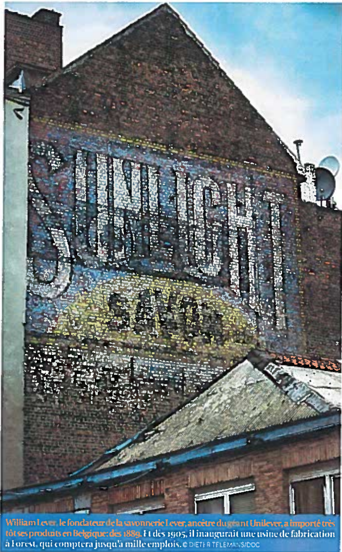
William Lever, le fondateur de la savonnerie Lever, ancêtre d'aujourd'hui Unilever, a importé ses produits en Belgique, dès 1888. Et dès 1905, il inaugura une usine de fabrication à Forest, qui comptera jusqu'à mille emplois.