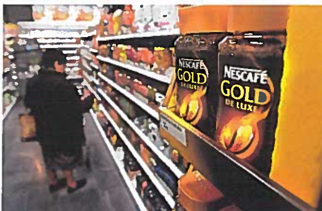
Nestlé zegt geen prijsverhogingen te kunnen doorvoeren zonder zijn concurrentiepositie te ondermijnen.

De grootste voedingsgroep ter wereld raakt maar niet op kruissnelheid. Ook over het eerste halfjaar van 2016 viel de groei van Nestlé tegen.